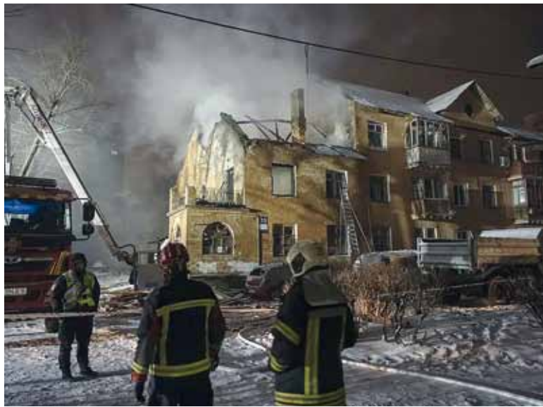
De madrugada. Mortal ataque de Rusia a Kiev.

El alcalde de la capital ucraniana, Vitali Klitschko, pidió a