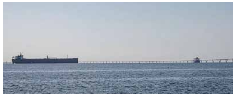
En el Caribe. Estados Unidos interceptó otro buque petrolero.

En una acción coordinada que contó con la participación de infantes de Marina que abordaron el buque.