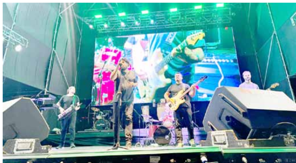
Álamo en el escenario, la banda de 9 de Julio que ofició de telonera de Lucas Sugo, anoche, al cierre de esta edición.

resaltó la organización: “Estamos encantados, la atención en el evento es muy buena, todo está saliendo excelente”. La competencia de la pizza formó parte de la primera jornada del festival “Sabores de la Rural”, que se realiza en el predio de