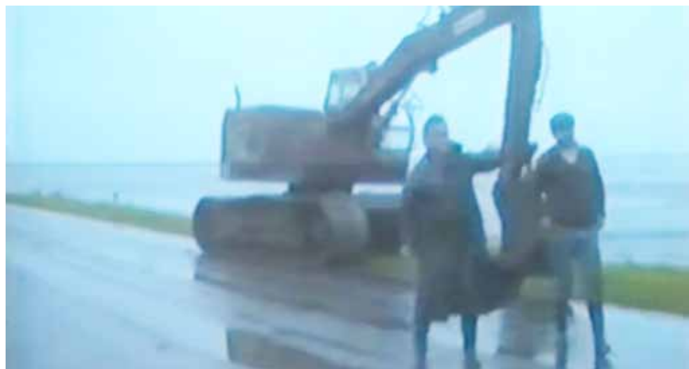
Una de las imágenes de la película que narra la epopeya de la voladura de la ruta 226 y las implicancias de las inundaciones que asolaron la ciudad en 1985.