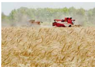
Cifras récord. Para las cosechas de trigo, como las de cebada y maíz.

El complejo sojero se mantendría como el principal exportador con 19.500 millones de dólares,