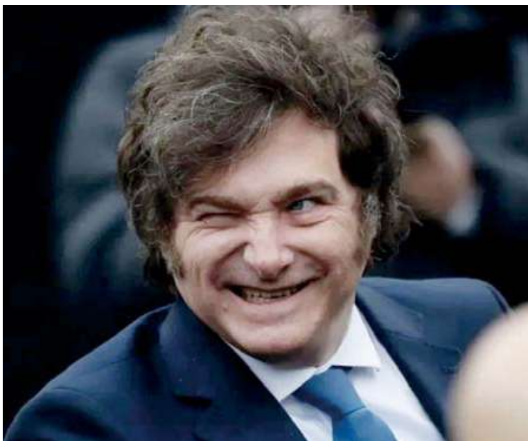
Enemigo. El presidente argentino impulsa un bloque regional de derecha.

Milei sostuvo que “el régimen de (Nicolás) Maduro es a América Latina hoy, lo que fue Cuba, el castrismo en los 70. Básicamente