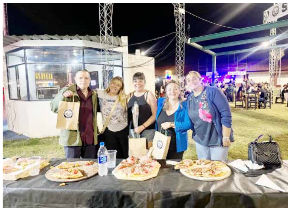
El jurado (foto izquierda, arriba) eligió por unanimidad la pizza ganadora.