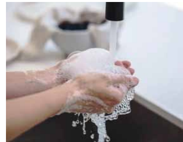
Malas noticias. Nuevo ajuste de ABSA para febrero.

El ajuste para los usuarios de Aguas Bonaerenses (ABSA) será del 40% a partir de febrero, que llevará la boleta promedio a $18.410.