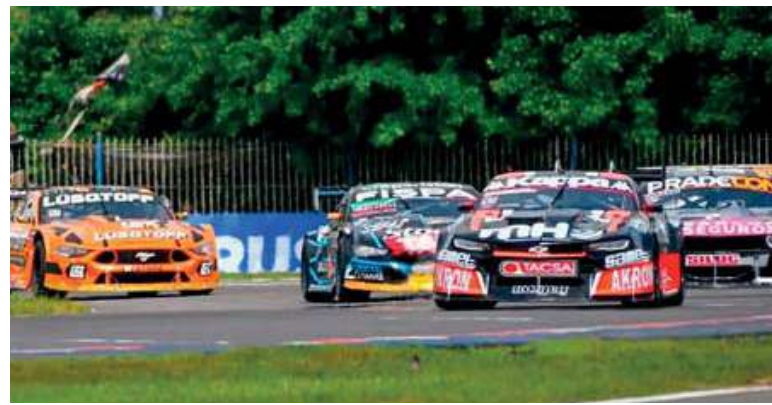
Novedad. Cargas adicionales por rendimiento.

La medida fue confirmada con la publicación del Reglamento Técnico 2026 y responde a lo ocurrido en un campeonato 2025 atípico, marcado por la amplia superioridad de Agustín Canapino. La Copa de Oro quedó prácticamente senten-