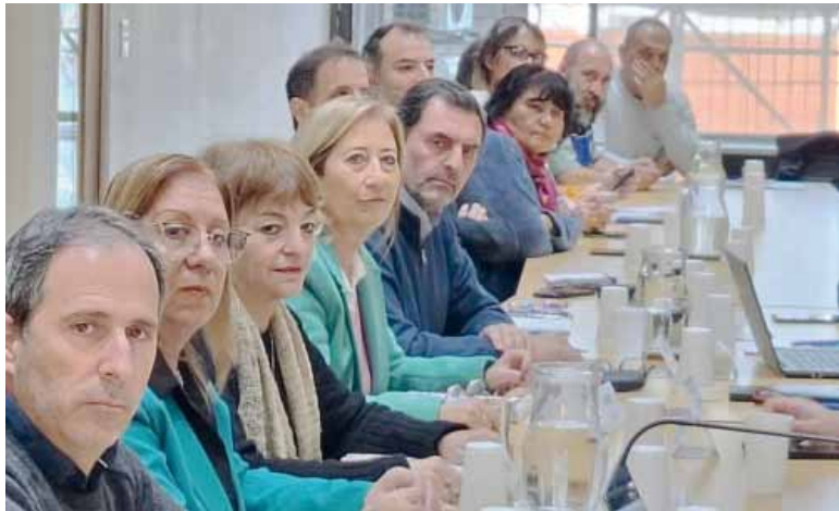
Paritarias. Una reunión de paritarias con gremios docentes.

Los judiciales remarcaron, como vienen haciendo el resto de los gremios estatales, dos cuestiones: la inflación erosiona el salario