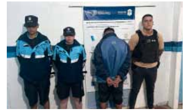
Capturado en San Clemente del Tuyú

Un joven que era buscado desde septiembre del año pasado por asesinar durante un robo al papá de un policía fue detenido en San Clemente del Tuyú. En el caso ya había un arrestado.