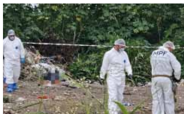
Hallazgo del cuerpo de la joven

Una joven fue hallada asesinada en la provincia de Tucumán y hay hermetismo debido a que, por el momento, no hay detenidos ni sospechosos, aunque sí confirman que se trató de una muerte violenta.