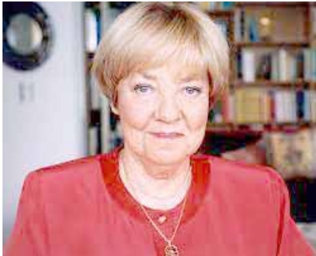
María Elena Walsh.

1901 - Se descubre petróleo en Beaumont,