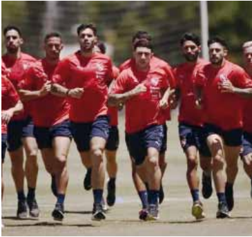
Examen. Ensayo de pretemporada.

las semifinales de la última Copa América, en Columbus, Ohio. El cierre será el 7 de marzo ante Canadá, rival al que ya derrotó en un amistoso disputado en abril del año pasado, en Nueva Jersey. Será la segunda participación argentina en la SheBelieves Cup, tras su estreno en 2021, cuando finalizó en el cuarto puesto. La competencia se presenta como una oportunidad valiosa para medir el progreso del equipo, ajustar detalles tácticos y sumar rodaje internacional frente a potencias del fútbol femenino, en un proceso que busca consolidar a la "Albiceleste" como protagonista a nivel mundial.