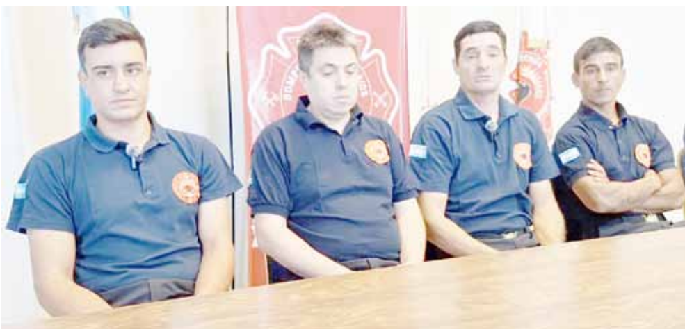
Bomberos que ofrecieron la conferencia de prensa.

el bombero que hizo el descenso con él que es una persona alta, pero eso no fue motivo de demora para el descenso, que duró alrededor de 10 minutos. “Desde que salen al vacío, que quedan colgado, hasta que llegan al piso, tardaron casi 10 minutos. No se puede hacer un descenso muy rápido porque los sistemas de seguridad que tenemos funcionan a cierta velocidad, y si te pasás se bloquean. Por todo una serie de condiciones, los rescates con cuerda no son rápidos”, explicaron a modo de cierre.