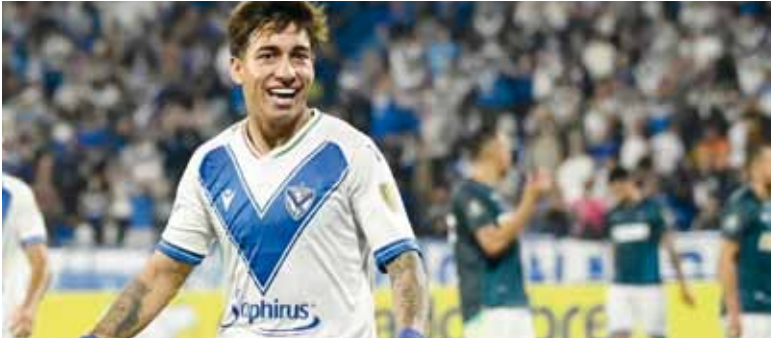
Crack. La oferta a Vélez ya fue presentada y el interés europeo aparece como el principal obstáculo.

La oferta a Vélez ya fue presentada y el interés europeo aparece como el principal obstáculo.