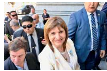
A “militar” la reforma laboral

La jefa del bloque de senadores de La Libertad Avanza (LLA), Patricia Bullrich, visitará este sábado Mar del Plata, donde realizará recorridos y reuniones con representantes de diferentes sectores sociales y económicos para debatir la reforma laboral, como parte del impulso que recobró el Gobierno tras el receso de los primeros días del año.